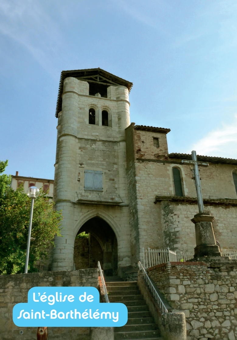
L'église de Saint-Barthélemy